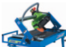
Řezání pod úhlem.

Speciální vedení přívodního kabelu, zabraňující poškození kabelu v pracovním prostoru pily.