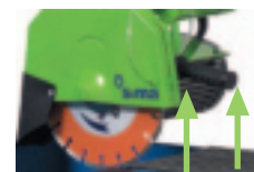
Nastavování hloubky řezu.

Speciální vedení přívodního kabelu, zabraňující poškození kabelu v pracovním prostoru pily.