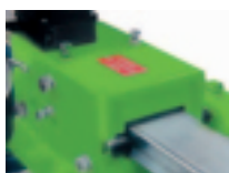
Vymezování svislé a vodorovné vůle.