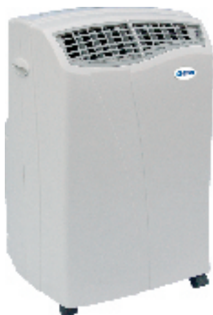
AC 10 R AC 12 R