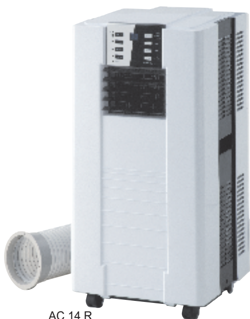
AC 14 R